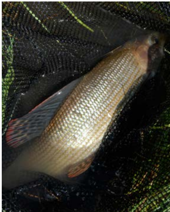
PEN: Harren er ikke like fargerik som fetter ørret, men likevel en vakker fisk.

Som den rastløse fiskernatur jeg er, er jeg er ikke typen som kan sette meg ned og vente i det lange og brede på et lovende vak. Noen ganger kan det sikkert være dumt, men som oftest til nytte. Allerede kvelden før hadde jeg sjekket ut den vesle Nøra, som