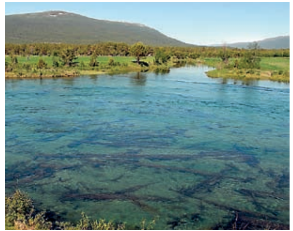
SAMLØP: Lågen møter Lora og blir ei ordentlig elv. Samløpet er en populær fiskeplass.

Egentlig skulle denne kvelden avsluttet mitt opphold øverst i Gudbrandsdalen, men neste morgen booker jeg hytta på Rolstad Camping for enda en natt. Det går stor fisk på sone 7, og jeg vil gi meg en sjanse til, selv om jeg er litt i tvil om jeg får noen: St. Hans er så vidt passert, og sommervarmen har satt inn for fullt. Elva er nesten flomstor, og stadig stigende. Jeg trenger ikke løfte blikket veldig høyt for å konstatere at det fortsatt er skiføre i fjellet, og med en dagtemperatur på nærmere 30 grader er det fart i snøsmeltingen. Det er særlig om nettene vannstanden stiger, og på streknin-