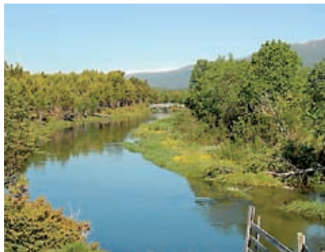
ALLER ØVERST: Ned til samløpet med Lora er Lågen ikke stort mer enn en bekk.