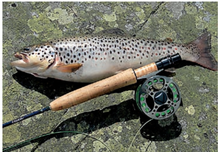
BLANK KUBBE: Feite fisker i halvkilosklassen, går det ganske mange av på sone 7.