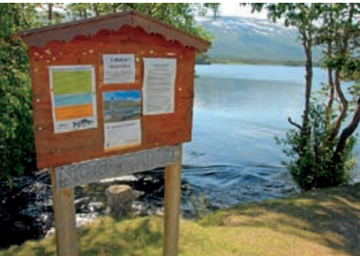
FORSIKTIG START: Ved utøset fra Lesjaskogsvatnet starter Gudbrandsdalslågen sin ferd mot Mjøsa.